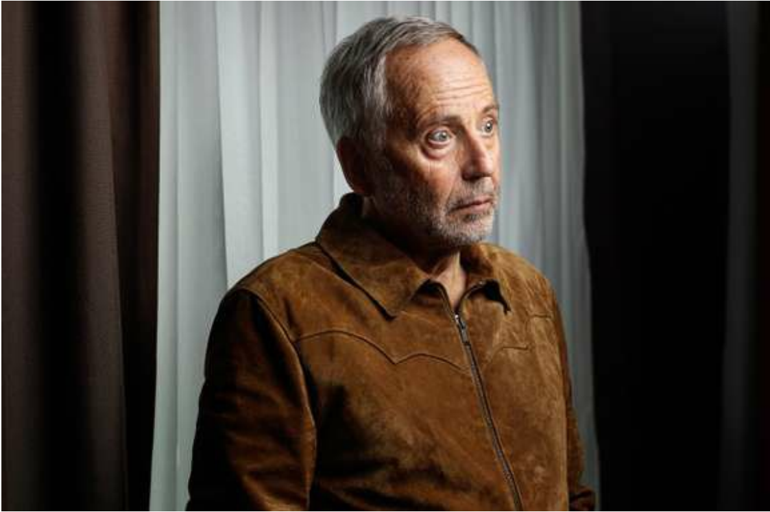
Festival de Cannes 2019 : pour Fabrice Luchini, « la politique est une névrose très mystérieuse »