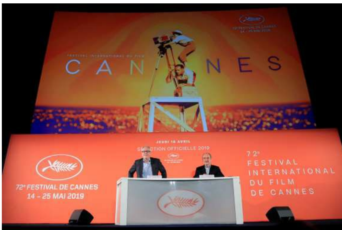
Festival de Cannes 2019 : Mati Diop, Jessica Hausner, Justine Triet et Céline Sciamma, quatre nouvelles venues dans la compétition