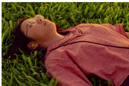
Netflix : « Shirkers », film fantôme singapourien