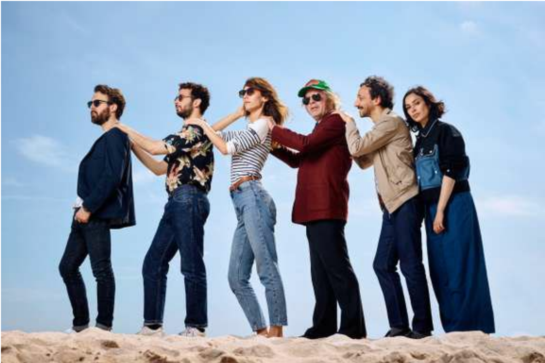
Festival de Cannes 2019 : 41 portraits qui ont marqué la 72e édition