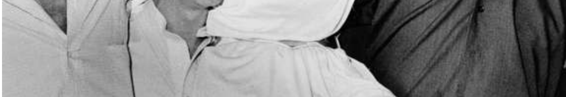
Peter Mayhew, le Chewbacca de « Star Wars », est mort