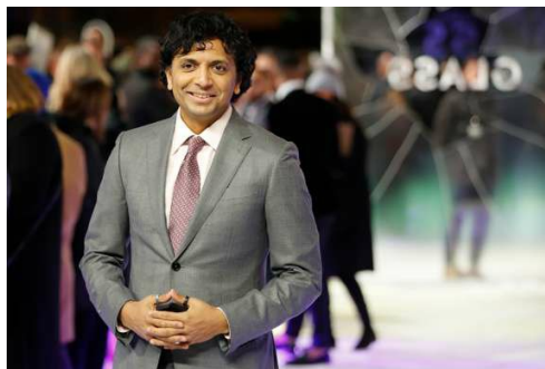
M. Night Shyamalan : « La bande dessinée, c'est déjà du cinéma »