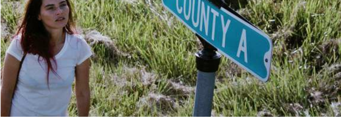
Festival de Cannes 2019 : « Lillian », un récit de survie entre Amérique et Sibérie