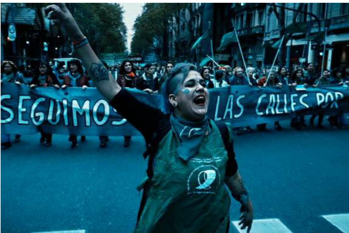
Festival de Cannes 2019 : « Que sea ley », l'âpre lutte des Argentines pour le droit à l'avortement