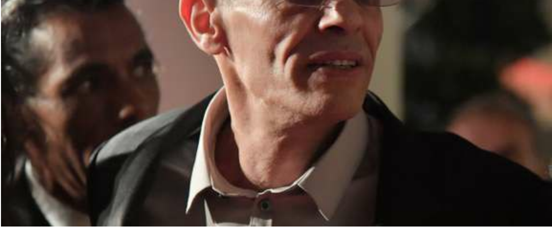
Cinéma : Abdellatif Kechiche dénonce un « complot » contre lui