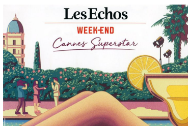
Echos d'un jeune chef op' dans "Les Echos"

Des cinéastes vantent "le modèle de financement" du cinéma français